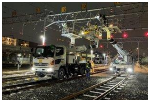
（軌陸車による架線工事）