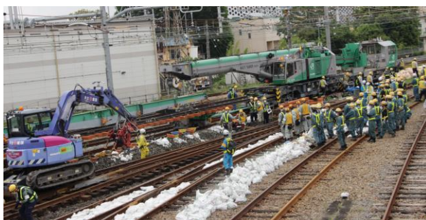
【写真】 工事イメージ（鉄道クレーン車による線路工事）