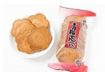
青梅せんべい 【柳丸】