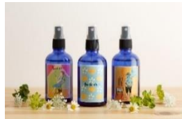
ポメロウォーター化粧水 【オーガニックコスメ フルフリ】