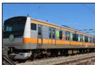
「東京アドベンチャーライン」ラッピング列車