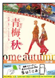
「青梅市」イメージポスター