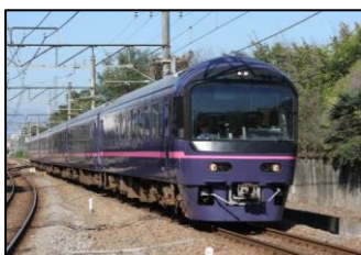
お座敷 青梅奥多摩号

※1 10月9日(土)、10日(日)運行の奥多摩行き臨時列車車内では「山のふるさと村」ビジターセンタースタッフによる車内イベントを実施します。