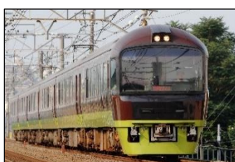
アドベンチャーライン