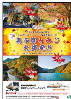
「奥多摩もみじ大爆発」ポスター