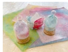
ミニランタン 【ひので和紙 新しい紙漉き】