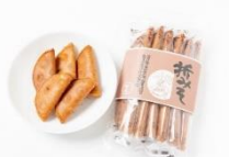
折みそせんべい 【柳丸】