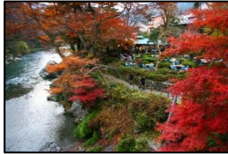
【御嶽コース】御岳渓谷遊歩道