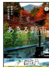
「あきる野市」イメージポスター