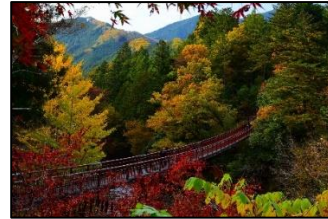
【武蔵五日市コース】石舟橋