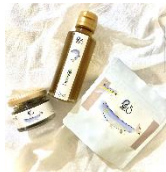
鮎チョコビ・鮎オイル・鮎ふりかけ 【do-mo factory blan.co】

内 容：全国でも高い評価を得ている秋川の清流で育った鮎を使った調味料、多摩産材で作ったキッズチェアやまな板、和紙の雑貨、苔のアクアリウム、自然や動物をモチーフにした陶器のオブジェなどを八王子駅で初めて販売します！