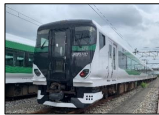
おうめ93号・94号 (新宿・青梅奥多摩号)