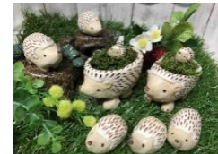
親子ハリネズミの植木カップ 【陶器オブジェ・ちくちくちん】