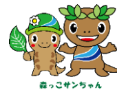
あきる野市キャラクター 森っこサンちゃん