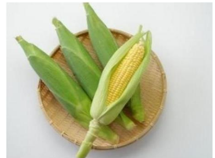
朝採りとうもろこし『きみひめ』

※6月17日（木）～20日（日）も10：00より「やまたまや」にて販売予定です。（通常配送）