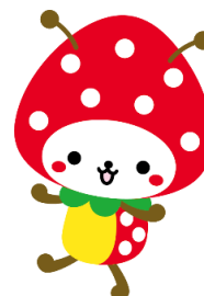
山武市マスコットキャラクター 「SUN ムシくん」