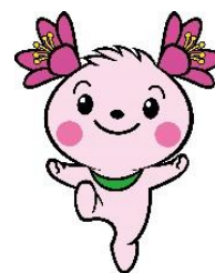
君津市マスコットキャラクター 「きみぴょん」