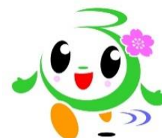
富津市おもてなしキャラクター 「ふつつん」