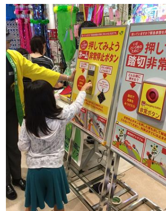
非常ボタン体験の様子