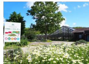
大多喜ハーブガーデン