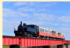
房総里山トロッコ