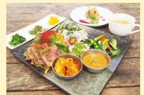
オリジナルランチ