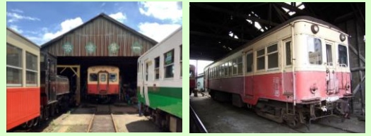
小湊鐵道五井機関区