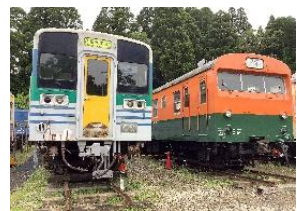
ポッポの丘(展示車両見学)