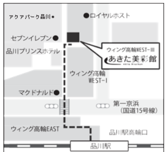
あきた美彩館外観・地図