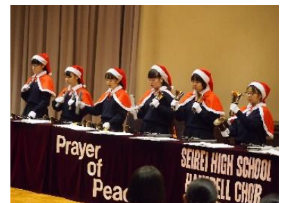
【ハンドベル演奏（イメージ）】