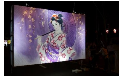
【七夕絵どうろう（イメージ）】