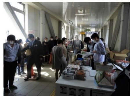
「よこてのみどり市」(イメージ)

※ 新型コロナウイルスの感染状況や輸送障害等により、イベント内容を変更または中止とする場合があります。予めご了承ください。