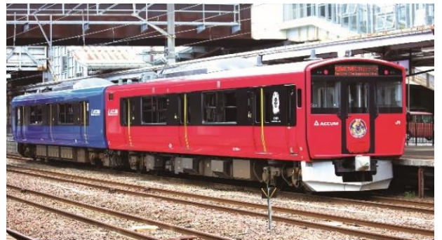
交流蓄電池電車「ACCUM」EV-E801 系(イメージ)