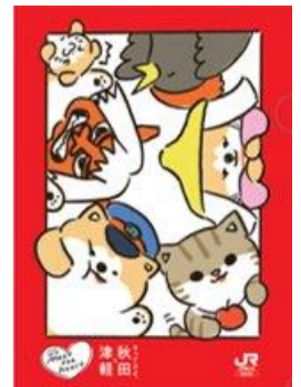
<クリアファイルイメージ>