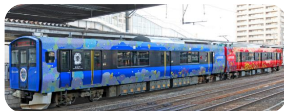
【BLOOMING TRAIN OGA】