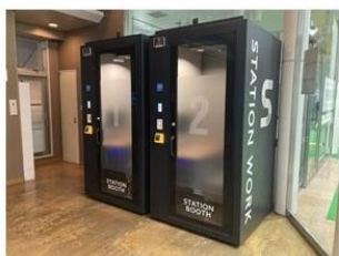
▲ STATION BOOTH