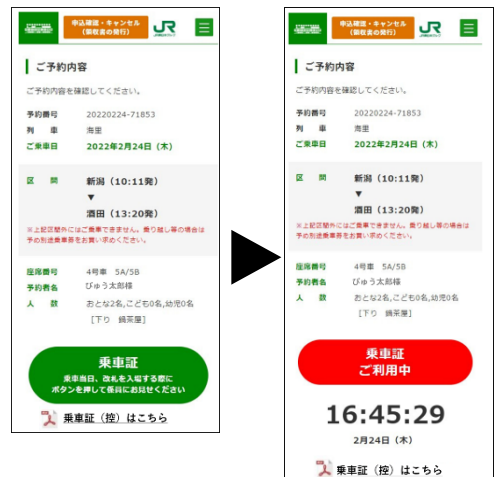
デジタル乗車証(イメージ)

※スマートフォン等をお持ちではない場合は、デジタル乗車証(控)の発行が可能です。ご旅行当日に印刷してご提示いただければデジタル乗車証同様に購入区間の駅での入出場が可能です。