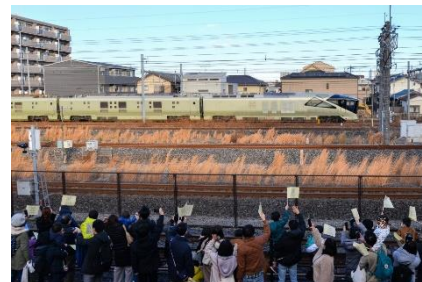
※イベントイメージ