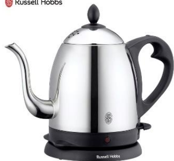
ラッセルホブス カフェケトル 0.8L