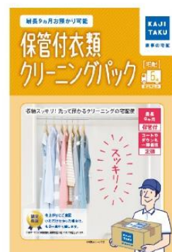
最長9か月間保管可能！ 衣類クリーニングパック 6点