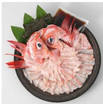
知床半島斜里町産 きんきの味わい鍋セット