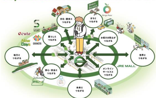
Beyond Stations 構想 「通過する」「集う」から「つながる」へ。

駅を「交通の拠点」から「暮らしのプラットフォーム」へと転換します。ヒトの生活における「豊かさ」を起点として駅空間の配置と機能を変革するとともに、JRE POINT 生活圏の拡充を通じ、お客さまや沿線のみなさまの暮らしとつながっていきます。お客さまと、暮らしを支えるサービス、地域・地方、デジタル、安全安心をつなぎ、さらにお客さま同士のつながりを創発することで、お客さま一人ひとりの可能性を拓き、私たちだからこそ提供できる「心豊かな生活」を実現していきます。