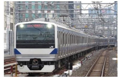
上野東京ライン（常磐線直通）