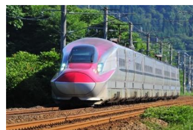
秋田新幹線「こまち」

山形新幹線の全車指定席化にあわせて、従来よりもわかりやすく、ご利用しやすい特急料金に見直します。また、同じ料金体系の秋田新幹線も特急料金を見直します。