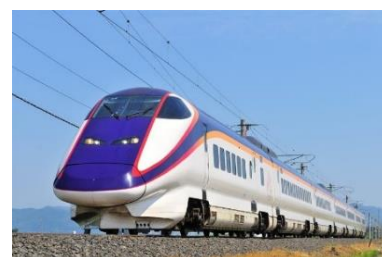
山形新幹線「つばさ」

全車指定席として安心して快適な指定席サービスの提供を通じて、お客さまの着席ニーズにお応えします。