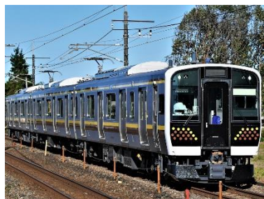
E131系（宇都宮線、日光線）