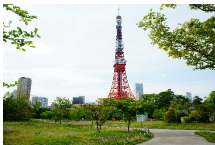
ザ・プリンス パークタワー東京（プリンス芝公園）

品川駅→グランドプリンスホテル高輪→洞坂→桂坂→天神坂→覚林寺（清正公）→絶江坂→ 仙台坂→大黒坂→七面坂→ザ・プリンス パークタワー東京→西應寺→亀塚公園→高輪大木戸跡 →高輪ゲートウェイ駅