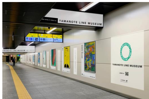
【YAMANOTE LINE MUSEUM イメージ】

気鋭のアート作品を駅の広告フレームで展示します。 日々の暮らしに、新しい世界への入口をつくります。