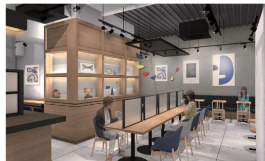
【ToMoRow Gallery イメージ】

■内容 JR東日本グループが運営する店舗内で初の、 コーヒーショップ併設のアートギャラリーです。 不定期でアーティストの作品が入れ替わり、訪れるごとにアートとの新たな出会いを楽しめるスペースに生まれ変わります。