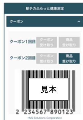
クーポン表示画面イメージ

※割引クーポンは 2 回目の測定結果登録・アンケート回答までのご提供となります。また、NewDays シアル横浜店以外でのご利用はできません。 ※以下の商品との同時会計、及びその他キャンペーンとの併用はできません。