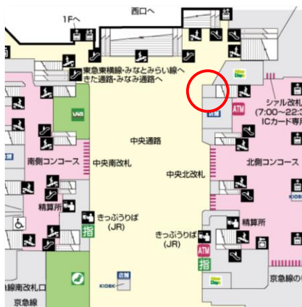
横浜駅中央通路 略図

(3) 場所:YOKOHAMA SEEDS(JR 横浜駅中央通路内) (左下図赤丸)