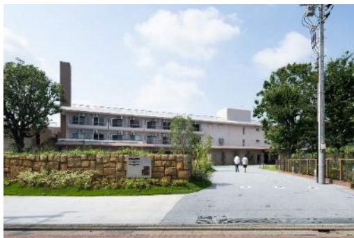
リノベーションによる多世代居住の場づくり 「リエットガーデン三鷹」