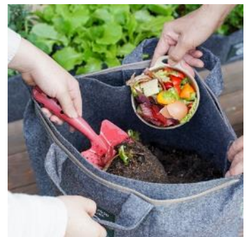
コンポストで始まる 循環の生活実装デザイン