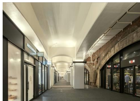
鉄道高架下の商業空間 「日比谷 OKUROJI」