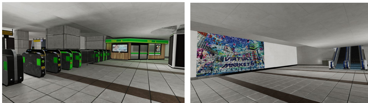
「バーチャル秋葉原駅」内観 ※画像は開発中のものです

「バーチャルマーケット6」の来場方法については、以下HPをご参照ください。VR機器をお持ちでない方でも、PCから来場可能です。 https://vket6.v-market.work/access