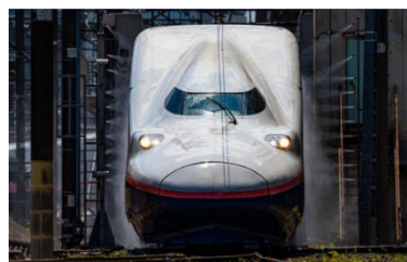
【車体洗浄イメージ】