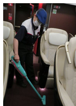
【グランクラス清掃イメージ】