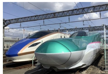
東京新幹線車両センター