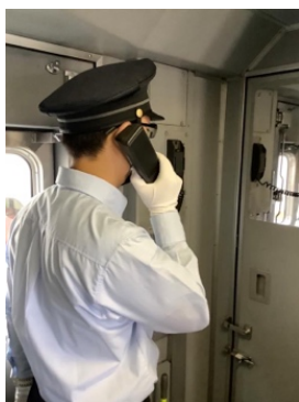
【車掌のお仕事体験イメージ】