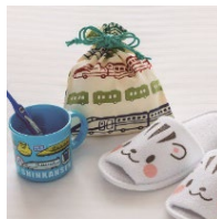
【特別アメニティー】