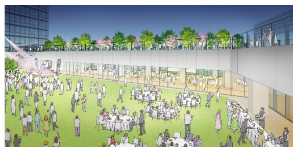
7階屋上庭園に面したレセプション会場