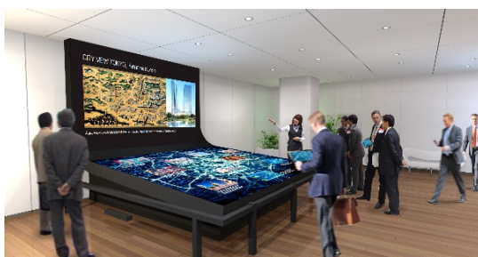
DMO 活動施設のイメージ