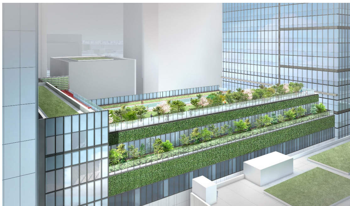
旧芝離宮恩賜庭園と立体的な繋がりを意識した屋上緑化

建物低層部の緑化計画を見直し、旧芝離宮恩賜庭園や隣接街区・大門通り等、周辺環境との緑の連続性を強化します。