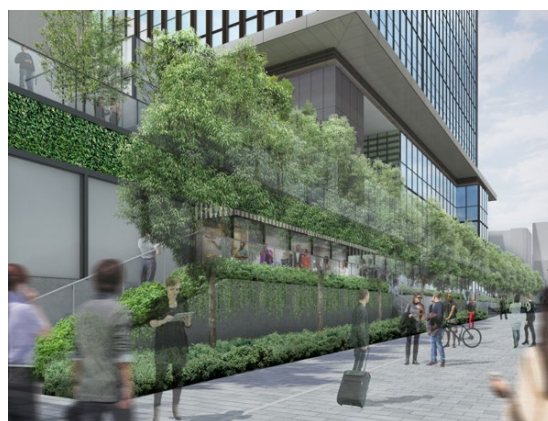
大門通り側の緑化軸を強化