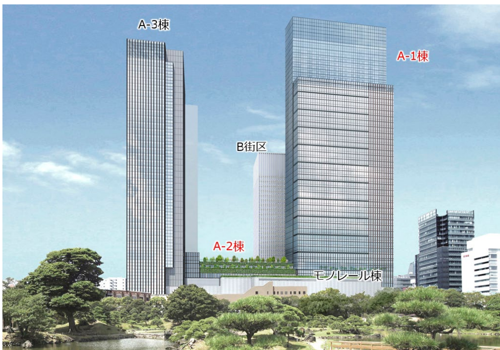
外観イメージ/旧芝離宮恩賜庭園より

具体的には、当初の都市計画提案における整備(交通結節機能の強化、国際交流拠点の形成、交通結節点における防災機能の強化と環境負荷低減)に加え、新たな整備(観光拠点・都心型MICE拠点の形成、防災性向上と環境負荷低減への一層の取組)を行い、陸・海・空の交通結節点である浜松町に相応しい拠点づくりを行ってまいります。