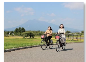
サイクルネット HIROSAKI (イメージ)