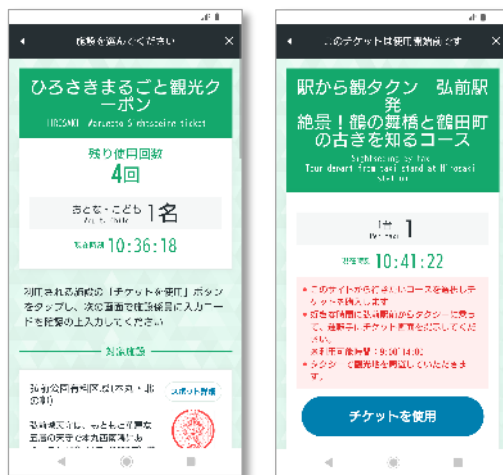
チケット画面(イメージ)

飲食やお買物、日帰り入浴などに使える共通電子チケット「東北 MaaS チケット」の利用可能店舗も順次拡大しています。