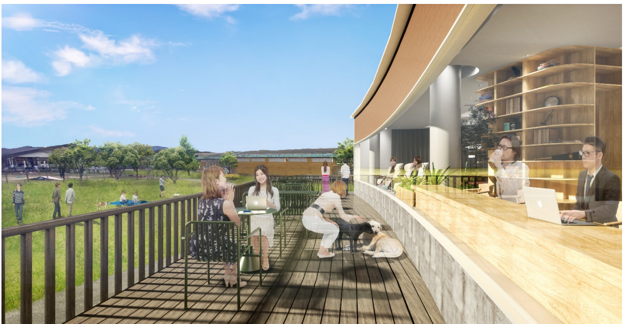
本ワーケーション施設完成イメージパース・現段階の予定であり今後変更になる可能性がございます

本プロジェクトを通じ、企業や個人にとって自分らしく働ける場所の必要性を社会に提案し、そのライフスタイルの浸透を応援しております。また、「プリンスグランドリゾート軽井沢」での過ごし方の選択肢を増やし、新たなライフスタイルを提案することにより、同エリアの一層のブランド価値の向上と軽井沢エリアの「ワーケーションリゾート」として、さらなる進化に繋げてまいります。