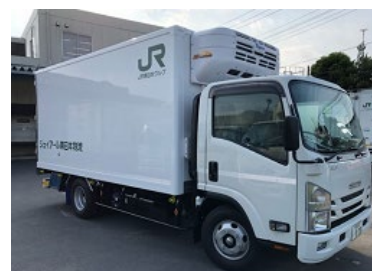
【東京駅からトラック等で納品先まで輸送】