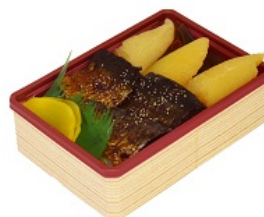
【練みがき弁当イメージ】