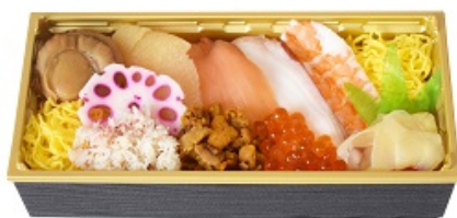
【蝦夷ちらしイメージ】

北海道キヨスク(株)の「駅弁の函館みかど」弁当工場にて製造した「蝦夷ちらし」と「練みがき弁当」を輸送し、東京駅構内の「駅弁屋 祭グランスタ店」にて販売します。