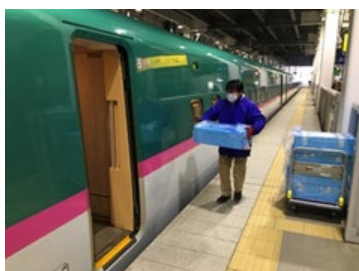
【新函館北斗駅ホームでの積み込み】