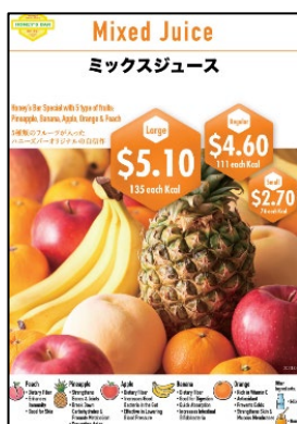
・ミックスジュース