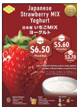
・日本産いちご MIX ヨーグルト