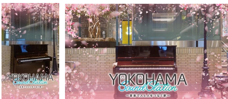
「桜のARフォトフレーム」イメージ

《楽しみ方》配信場所に設置されたQRコード(※2)にお客さまのスマートフォンをかざすと、エキュートエディション横浜や駅ピアノが桜のトンネルの中にあるようなARフォトフレームでの写真をご撮影いただけます(※3)。