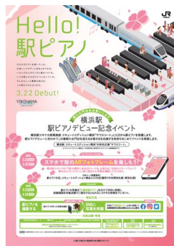
「B1ポスター (イベント告知)」イメージ