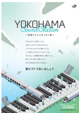
「B1ポスター (通年版)」イメージ

「音楽で人と人をつなぐ駅」をテーマに、主に横浜エリアで業務をする社員が立ち上げたプロジェクト名称です。今後、音楽を通じて駅を「人の集う魅力ある駅」にしていきたいという思いから、音楽に関わるイベントやキャンペーンなどを中心に様々な取り組みを進めていきます。