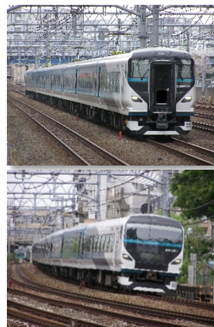
【特急「湘南」停車駅と時刻】

なお、これまで朝・夕夜間の通勤時間帯に運転している「湘南ライナー」・「おはようライナー新宿」・「ホームライナー小田原」は運転を取り止めます。