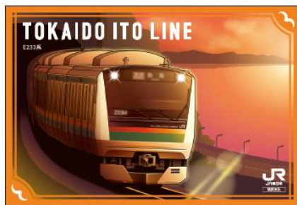
↑ (表) 列車イラスト