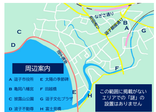
謎解きエリアマップ