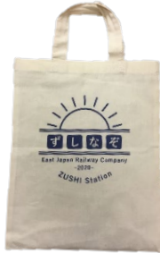
オリジナル コットンバッグ