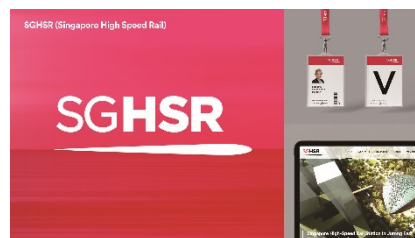
【Xinying代表作品①】Singapore High Speed Rail