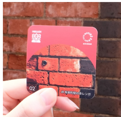
まち楽(ラク)ステッカー(イメージ)