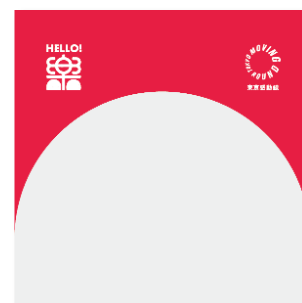
高架橋アーチデザイン(イメージ)

有楽町エリアの個性を表現し、有楽町の高架橋のアーチをモチーフにした共通デザインを使用しています。ステッカーおよびカードは「TOKYO SEEDS PROJECT 2019」にて海外のデザイナーから提案された内容をもとに有楽町駅社員がグループ会社とともに考案しました。