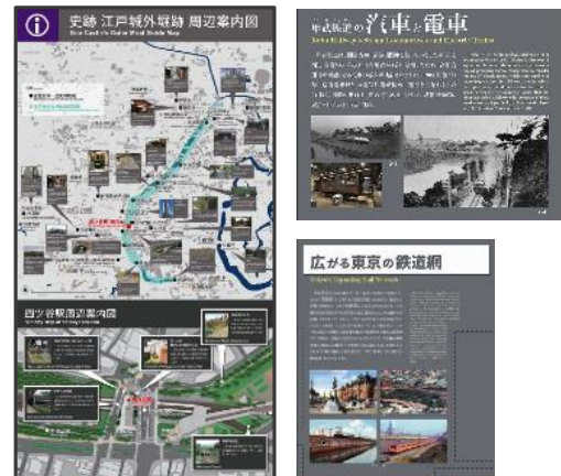
パネル展示(イメージ)