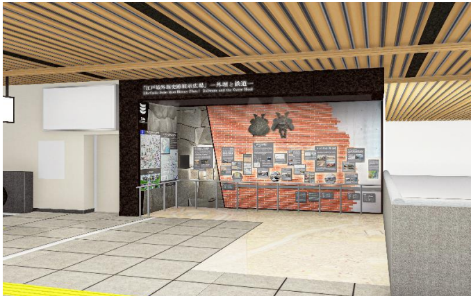
江戸城外堀史跡展示広場(イメージ)