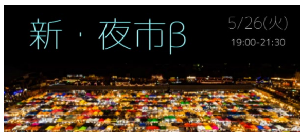
【専用ウェブサイト画面イメージ】