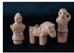
ミニミニ埴輪セット