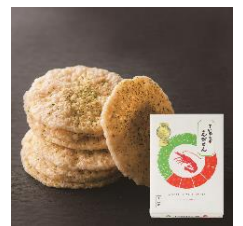
左：Suicaのペンギン 卯三郎こけし（駅長） 右：下仁田ネギえびせん 12枚入り2箱セット