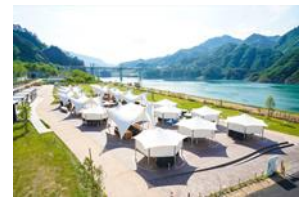
川原湯温泉あそびの基地 NOA