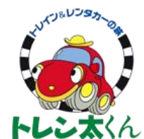
トレン太くん ロゴマーク