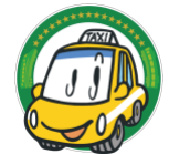
駅から観タクン ロゴマーク