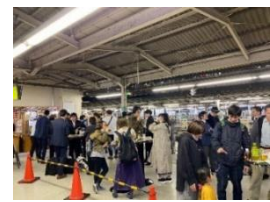
前回（2020年10月16日・17日実施）の様子