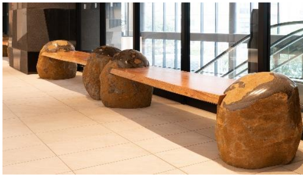
伊達冠石を使用したベンチ

本ビルの2階オフィスエントランス付近には、宮城県丸森町大蔵山でのみ産出される「伊達冠石」を使用したベンチやオブジェを設置しています。「伊達冠石」の特徴は、鉄分を多く含むため、表面は独特の褐色や錆色に覆われていますが、内部は一律に黒色を呈しており、鮮やかなコントラストが印象的な石材です。また、産出場所によって、ひとつひとつの石の表情がそれぞれ異なるのも大きな魅力です。