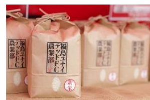
〈福島ユナイテッドFC農業部のお米〉