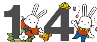
福島市観光PRキャラクター「ももりん」