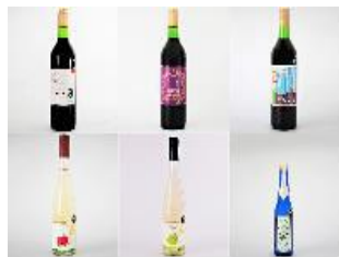
〈ふくしま農家の夢ワイン〉