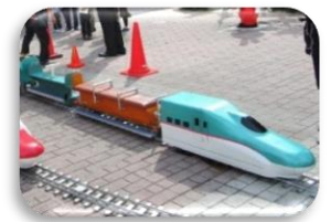
〈ミニ新幹線乗車体験〉