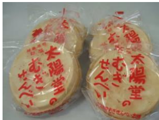
〈太陽堂のむぎせんべい〉