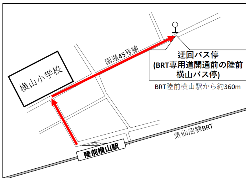
陸前横山駅 迂回バス停位置図