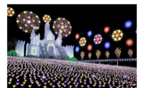
あしかがフラワーパーク

歴史ある蔵の街「とちぎ」の散策と2017年に日本三大イルミネーションに認定された、あしかがフラワーパーク「光の花の庭」をお楽しみいただけるプランです。500万球を超えるイルミネーションによる心温まる感動をご堪能ください。