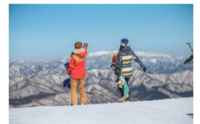
ハンターマウンテン塩原

リフト一日券と1,000円分のお食事券、那須塩原駅からスキー場までの送迎がセットになった、首都圏最大級のゲレンデを擁するハンターマウンテン塩原の日帰りスキープランです。