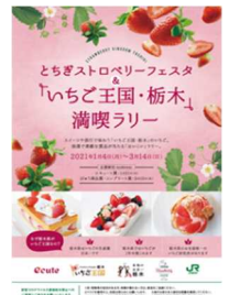
パンフレット兼満喫ラリー台紙

2021年1月4日（月）～24日（日）の期間中、エキュート大宮、エキュート上野、エキュート東京、エキュート京葉ストリートにおいて、栃木県主催の「とちぎストロベリーフェスタ」（後述）とコラボレーションし、「いちご王国・栃木」満喫ラリーを実施します。