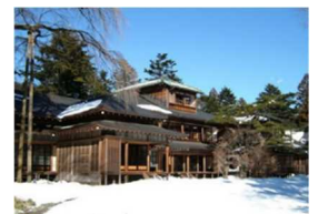
日光田母沢御用邸記念公園

宇都宮駅を出発し、2018年に日本遺産に認定された「大谷石文化」の息づく街「大谷」と、冬の荘厳な雰囲気の中、世界遺産「日光の社寺」、皇室ゆかりの「日光田母沢御用邸記念公園」をめぐる、歴史や文化をお楽しみいただけるバスツアーです。