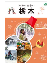
栃木県との共同作成パンフレット

主な駅において、栃木県との共同作成パンフレットとあわせて、栃木県内で働くJR東日本の社員が中心となり作成した、地域で働く社員ならではの視点で、地元の魅力や観光スポットをご紹介するパンフレットも掲出し、キャンペーンをPRします。