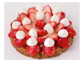
いちごスイーツの一例

○開催場所：エキュート大宮、エキュート上野、エキュート東京、エキュート京葉ストリート