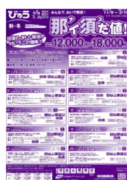
エリア限定お得な宿泊商品