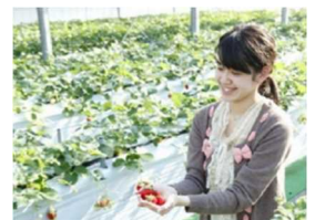
お菓子の城 いちご狩り

那須塩原駅からのレンタカーとお菓子の城 那須ハートランドでのいちご狩りがセットになったプランです。那須高原のドライブと「スカイベリー」の食べ放題がお楽しみいただけます。