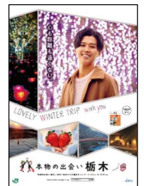
栃木県版ポスター