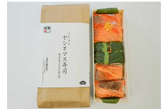
プレミアムヤシオマス寿司