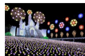
あしかがフラワーパーク

歴史ある蔵の街「とちぎ」の散策と2017年に日本三大イルミネーションに認定された、あしかがフラワーパーク「光の花の庭」をお楽しみいただけるプランです。500万球を超えるイルミネーションによる心温まる感動をご堪能ください。