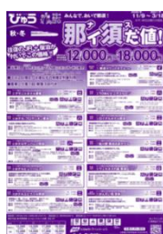
エリア限定お得な宿泊商品