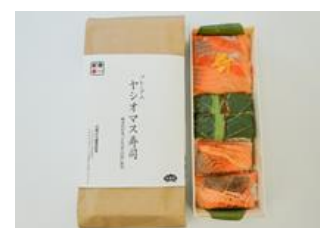
プレミアムヤシオマス寿司