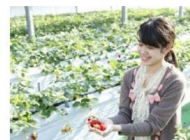
お菓子の城 いちご狩り

那須塩原駅からのレンタカーとお菓子の城 那須ハートランドでのいちご狩りがセットになったプランです。那須高原のドライブと「スカイベリー」の食べ放題がお楽しみいただけます。