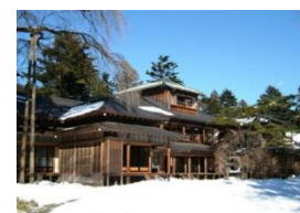
日光田母沢御用邸記念公園

宇都宮駅を出発し、2018年に日本遺産に認定された「大谷石文化」の息づく街「大谷」と、冬の荘厳な雰囲気の中、世界遺産「日光の社寺」、皇室ゆかりの「日光田母沢御用邸記念公園」をめぐる、歴史や文化をお楽しみいただけるバスツアーです。