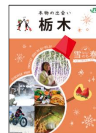
栃木県との共同作成 パンフレット

主な駅において、栃木県との共同作成パンフレットとあわせて、栃木県内で働くJR東日本の社員が中心となり作成した、地域で働く社員ならではの視点で、地元の魅力や観光スポットをご紹介するパンフレットも掲出し、キャンペーンをPRします。