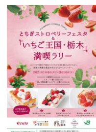
パンフレット兼 満喫ラリー台紙

※「いちご王国・栃木」満喫ラリーの詳細は、首都圏の主な駅でお配りするパンフレット兼満喫ラリー台紙をご確認ください。