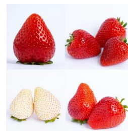
栃木を代表するいちご (スカイベリー、とちあいか、 ミルクベリー、とちおとめ)

団体臨時列車とバスのツアーで、栃木県の冬の味覚の代表である「いちご」の食べ比べをお楽しみいただける商品です。列車は、新宿駅から那須塩原駅までの運転で、小山駅から「県南コース」「県東コース」、那須塩原駅から「那須コース」と3コースのバスツアーに分かれて、いちご狩りと地元ならではの食事と体験をご満喫いただきます。