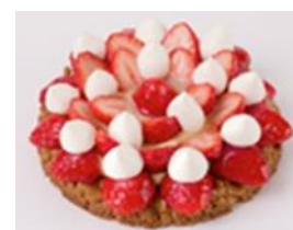
いちごスイーツの一例

○開催場所：エキュート大宮、エキュート上野、エキュート東京、エキュート京葉ストリート