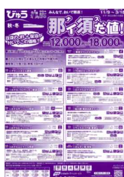
エリア限定お得な宿泊商品