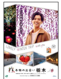
栃木県版ポスター