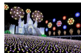
あしかがフラワーパーク

【びゅう旅行商品出発日：1/4～2/7】 歴史ある蔵の街「とちぎ」の散策と2017年に日本三大イルミネーションに認定された、あしかがフラワーパーク「光の花の庭」をお楽しみいただけるプランです。500万球を超えるイルミネーションによる心温まる感動をご堪能ください。