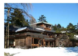
日光田母沢御用邸記念公園

【びゅう旅行商品出発日：1/9～3/28の土休日】※2/7まで運休 宇都宮駅を出発し、2018年に日本遺産に認定された「大谷石文化」の息づく街「大谷」と、冬の荘厳な雰囲気の中、世界遺産「日光の社寺」、皇室ゆかりの「日光田母沢御用邸記念公園」をめぐる、歴史や文化をお楽しみいただけるバスツアーです。