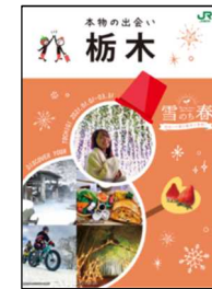
栃木県との共同作成パンフレット

主な駅において、栃木県との共同作成パンフレットとあわせて、栃木県内で働くJR東日本の社員が中心となり作成した、地域で働く社員ならではの視点で、地元の魅力や観光スポットをご紹介するパンフレットも掲出し、キャンペーンをPRします。