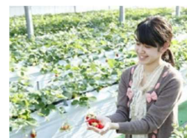
お菓子の城 いちご狩り

【びゅう旅行商品出発日：1/5～1/31】※発売停止 那須塩原駅からのレンタカーとお菓子の城 那須ハートランドでのいちご狩りがセットになったプランです。那須高原のドライブと「スカイベリー」の食べ放題がお楽しみいただけます。