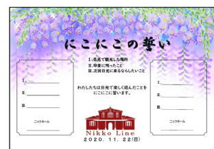
オリジナル記念シート （にこにこの誓い）