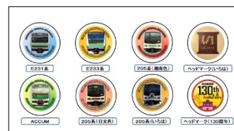
缶バッジデザイン