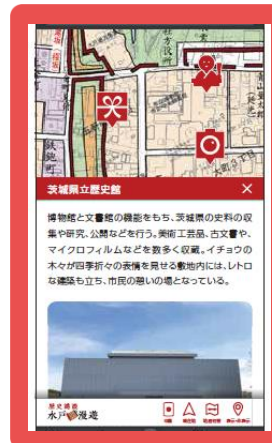
【オンラインマップ】 （イメージ）