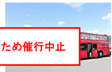
【オープントップバス】