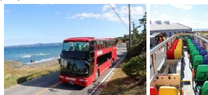
【オーパントップバス】