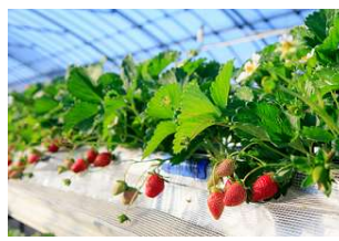
【館山いちご狩りセンター】