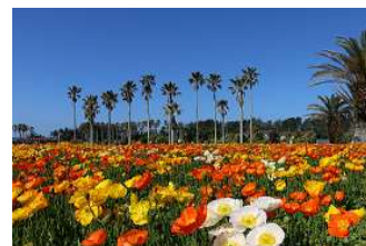
【館山ファミリーパーク】