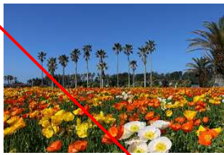
【館山ファミリーパーク】