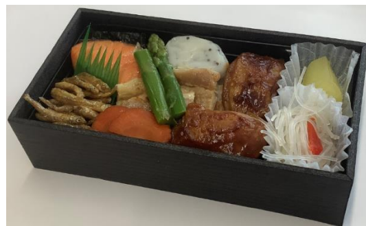
※写真はイメージです。 盛り付けなどは実際の商品と異なる場合があります。