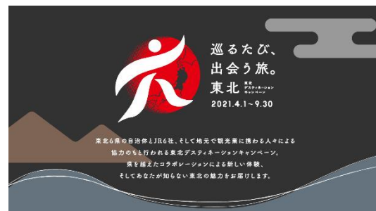
表示コンテンツ(イメージ)