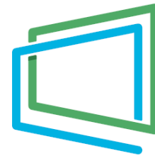
e-モーションウィンドウ