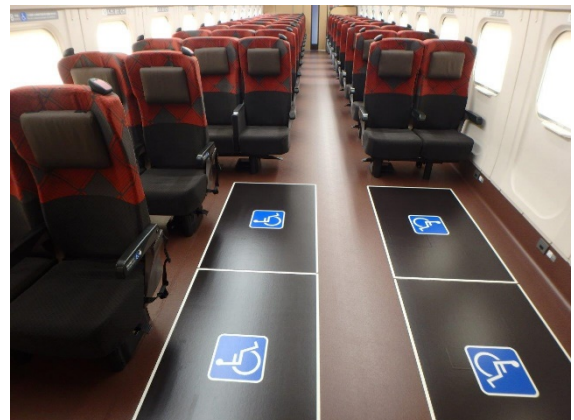
車いす用フリースペース設置イメージ