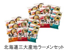
北海道三大産地ラーメンセット