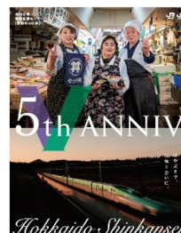
JR北海道版イメージ

北海道新幹線がつなぐ各地の人々にスポットをあて、旅情感を演出します。北海道、東北、首都圏などにおいて約3か月毎に新しいポスターを追加制作し、計8種類のポスターを順次展開していきます。 (JR北海道版:4種類、JR東日本版:4種類)