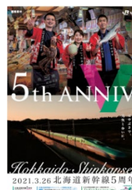
JR東日本版イメージ