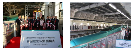
北海道新幹線開業出発式の様子

公式アカウントをフォローして、「#北海道新幹線でV」をつけて投稿をするだけで応募完了です。抽選で20名様に5周年オリジナルグッズをプレゼントします。