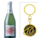
A-Factory シールド 10 周年記念ラベル & 10 周年記念キーホルダー