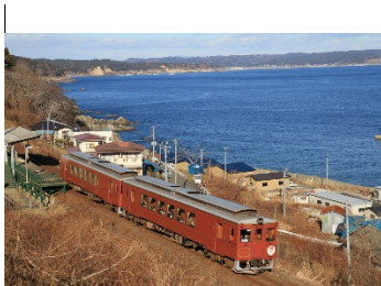
遠野ふるさと村で昔の遊び体験・三陸を走る冬のローカル線と三陸鉄道貸切列車の旅 (岩手県)