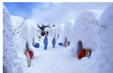
美しい雪原の「小岩井農場」で学ぶ「食育」&スノーシュー体験と八幡平・いちごのスイーツ作り (岩手県)